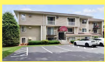
NORTH ATTLEBORO Condomínio $169.900