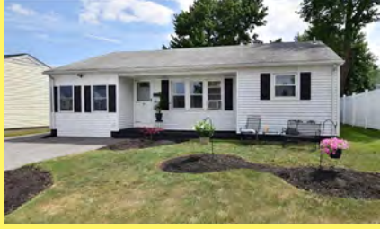
EAST PROVIDENCE Ranch $329.900