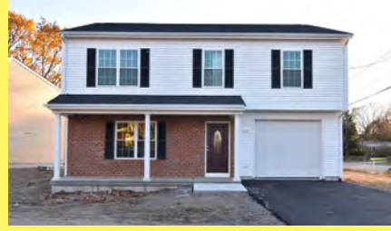
EAST PROVIDENCE Colonial $499.900