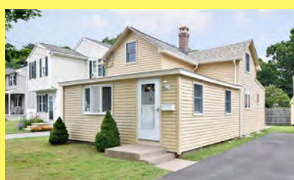
RIVERSIDE Cottage $199.900