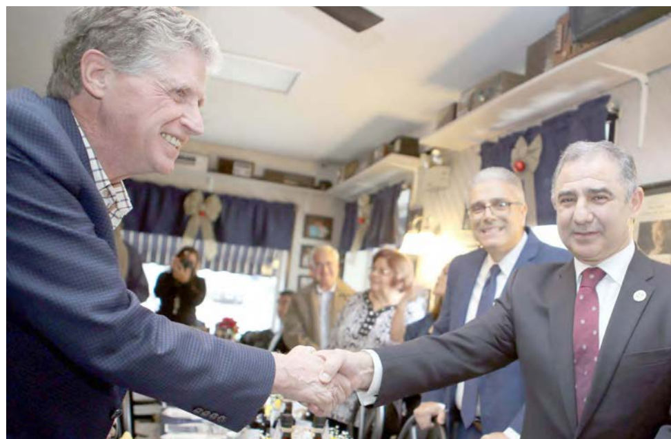
Dan McKee com José Bolieiro, presidente do Governo dos Açores em dezembro de 2021, vendo-se ainda na foto Robert Silva, mayor de East Providence.

“child tax credit”, isenção de impostos para idosos, diminuição de impostos em pequenos negócios. Isto são decisões de resolução imediata. Mas num período mais prolongado estamos a trabalhar para aumentar os lucros para os residentes de Rhode Island. Fazer de Rhode Island um melhor lugar para viver, com um investimento recorde de 250 milhões de dólares em habitação ao alcance de todos e a criação de postos de trabalho bem pagos. Por exemplo, temos a construção do estádio de futebol em Pawtucket. Eu dei prioridade a este projeto porque é bom