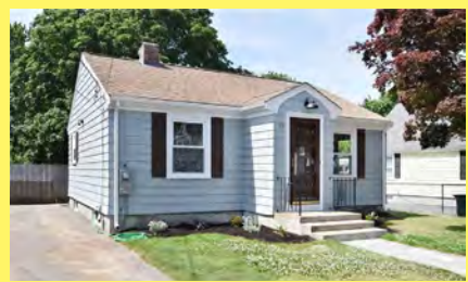
EAST PROVIDENCE Ranch $319.900