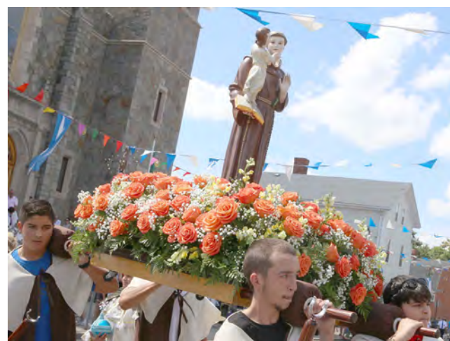
O andor com a imagem de Santo António transportado por jovens paroquianos da igreja de Nossa Senhora do Rosário em Providence na procissão do passado domingo.