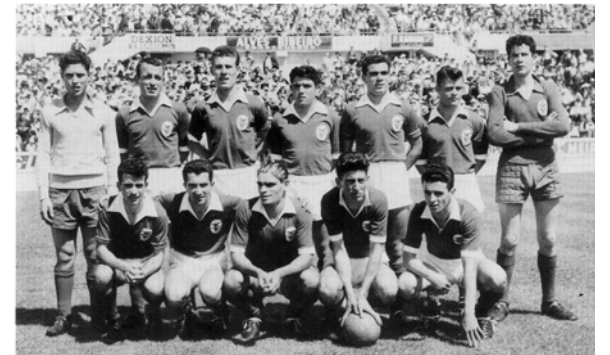
Campeões insulares (1960)

Nos primeiros anos do liceu, quando terminávamos uma aula e, na hora seguinte existia um buraco no horário escolar, havia uma rápida movimentação pelos corredores, seguida de forte correria pelo claustro do Convento de S. Francisco para ver quem chegava primeiro ao "Estádio da Pedra". O objectivo era marcar presença numa das equipas na jogatana que se seguia. De vez em quando, nas tardes desportivas, também organizávamos umas futeboladas no relvão, no pelado da Escola Comercial ou no campo do Seminário. No decorrer destes encontros, quando alguém fazia uma entrada mais forte sobre um colega, dizíamos de imediato, até parecemos "O Tractor".