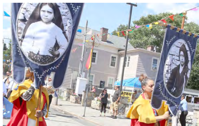
Evocação dos Três Pastorinhos de Fátima.