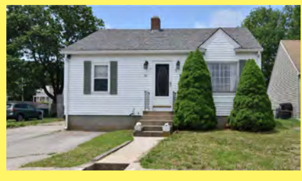
WEST WARWICK Cape $284.900