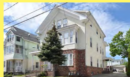
PAWTUCKET 3 moradias $469.900