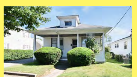
PAWTUCKET Bungalow $227.900