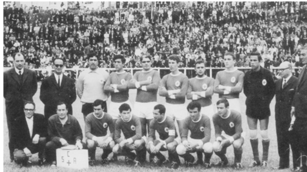
Campeões dos Açores (1967)