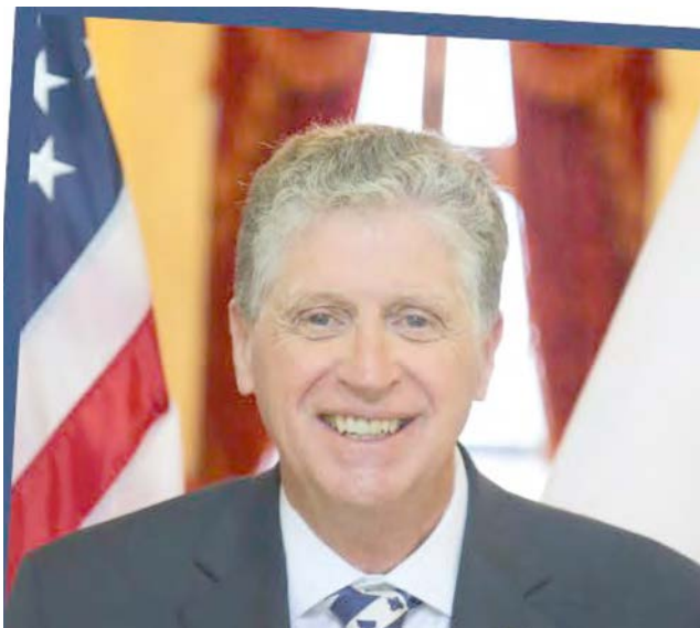
Dan McKee, governador de Rhode Island, candidato a mais um mandato.

Sem desprestígio, para os restantes candidatos, o governador de RI Daniel McKee é o governador com mais aproximação à comunidade portuguesa. Como mayor de Cumberland acompanhou a banda do Clube Juventude Lusitana numa memorável digressão a Penlva do Castelo, Beira Alta, Portugal. Desde mayor a governador tem sido uma presença assídua nas celebrações do Dia de Portugal, assim como nas grandes iniciativas lusas em Rhode Island”.