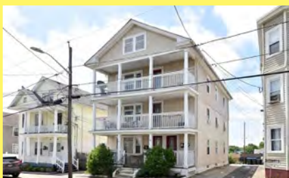
PROVIDENCE 3 moradias $499.900