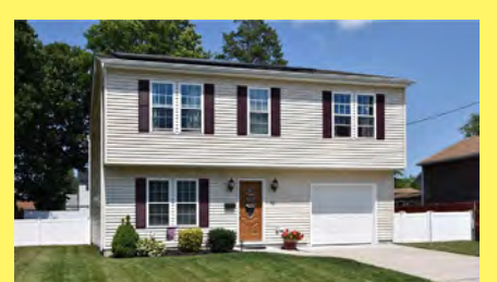
RUMFORD Colonial $449.900