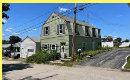
EAST PROVIDENCE 2 moradias $249.000