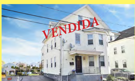
EAST PROVIDENCE 2 moradias $445.000