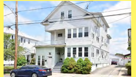
PROVIDENCE 4 moradias $589.900