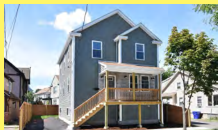
PROVIDENCE Colonial $359.900