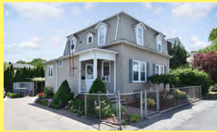
EAST PROVIDENCE 2 moradias $299.900