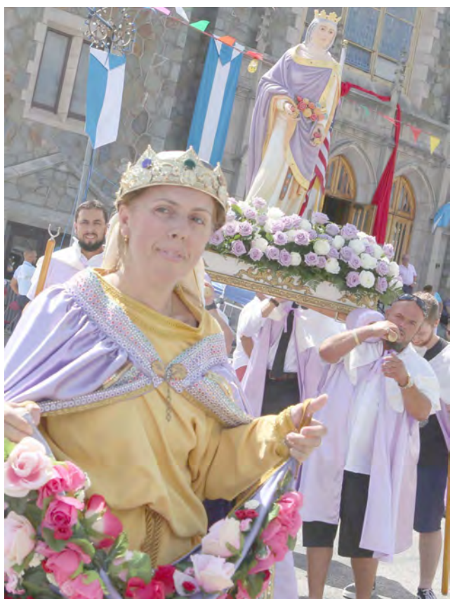
A "Rainha Santa Isabel" e o milagre das Rosas na procissão de Nossa Senhora do Rosário da igreja do mesmo nome em Providence no passado domingo.