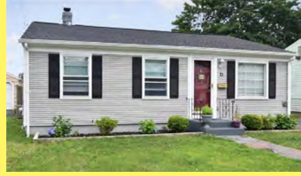
RUMFORD Ranch $329.900