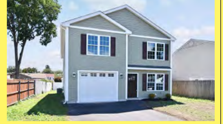
EAST PROVIDENCE Colonial $499.900