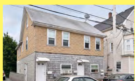
RIVERSIDE 4 moradias $369.900